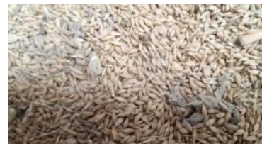
PRODUCTO ANTES DE CRIBADO